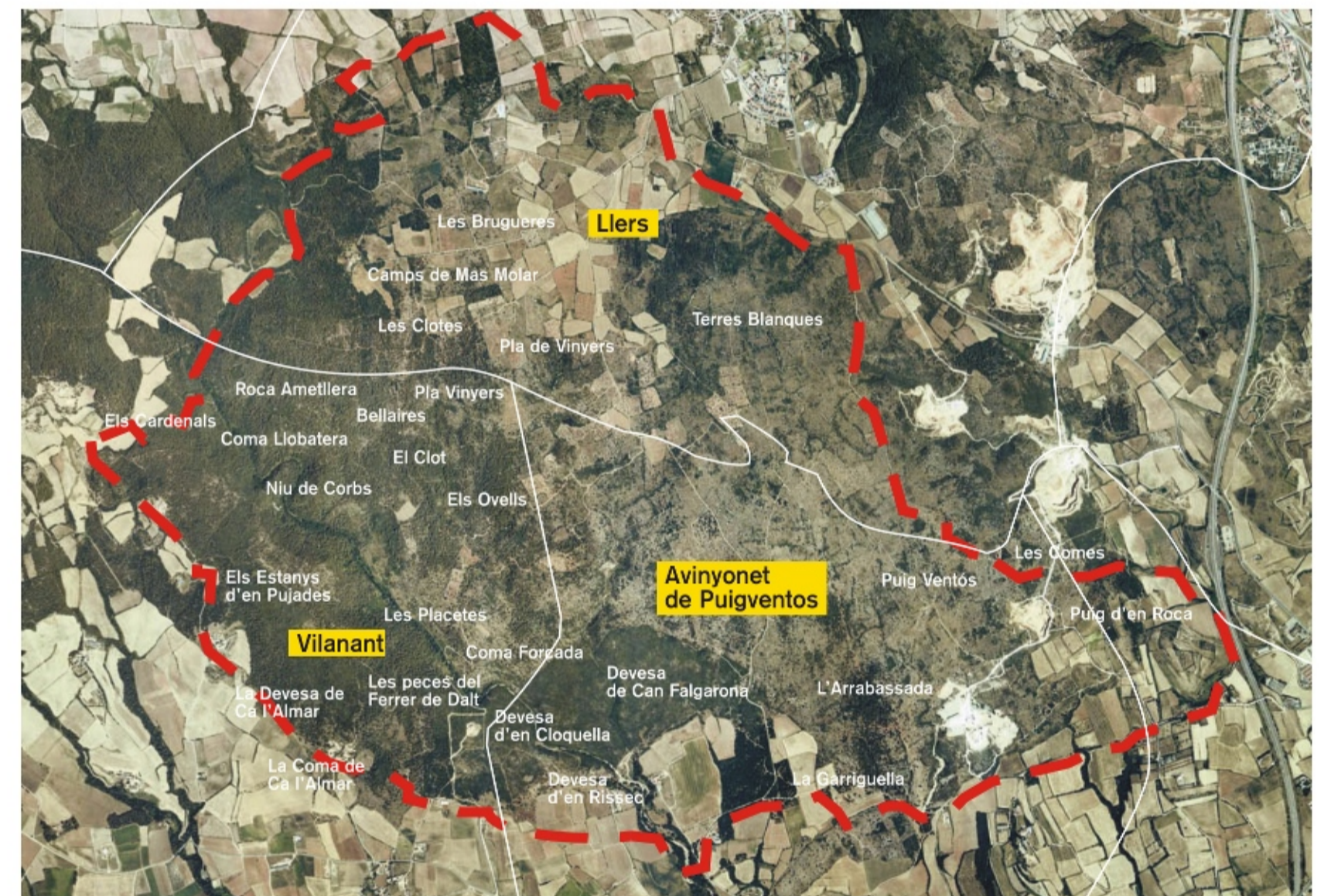
Àmbit de pla de gestió La Garriga d'Empordà

La Garriga d'Empordà es troba situada a la zona de contacte entre la plana empordanesa i la Garrotxa d'Empordà. El relleu d'aquest territori és suau, ondulat i de poc pendent, l'alçada màxima del qual supera lleugerament els 200 m. El seu paisatge ve emmarcat per les muntanyes de la Mare de Déu del Mont i Bassegoda a ponent, les Salines i l'Albera al nord i per la plana de l'Empordà a llevant. Aquest paratge n'ocupa els darrers turons, que, des de la serra de l'Illa, es fonen amb la plana entre les conques de la Muga i el Manol.